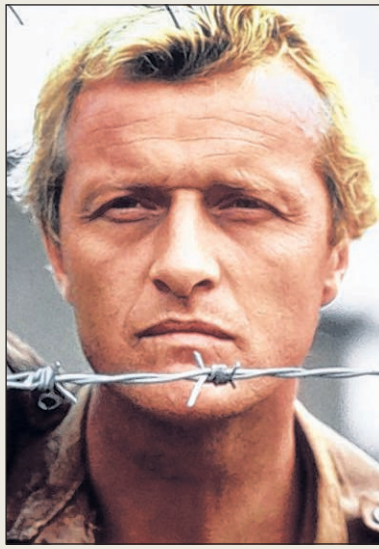
■ Rutger Hauer is Sasha in het waargebeurde Escape from Sobibor .

Rutger Hauer in de rol van opstandeleider Sasha, ooit al eens gezien, en vroeg me af of ik er nog voldoende van wist om er iets over te schrijven. Ja dus: Escape from Sobibor is één van die films die blijven hangen. Net als Schindlers list , een film die eenzelfde gevoel opwekt. Het zal ongetwijfeld met het (ook) mij aansprekende genre te maken hebben. Plus het feit dat je kijkt naar een waargebeurd verhaal, écht waar gebeurd, dus niet 'berust op...' of 'naar een...' zoals je tegenwoordig al te vaak in de aftiteling van het eerste de beste dinsdagavond drama tegenkomt. Na vijf minuten kijken – eigenlijk 'herkijken' – kan ik het verhaal weer dromen. Beelden van een trein die aankomt in Sobi-