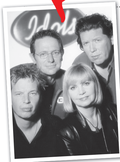
12 MIKRO GIDS